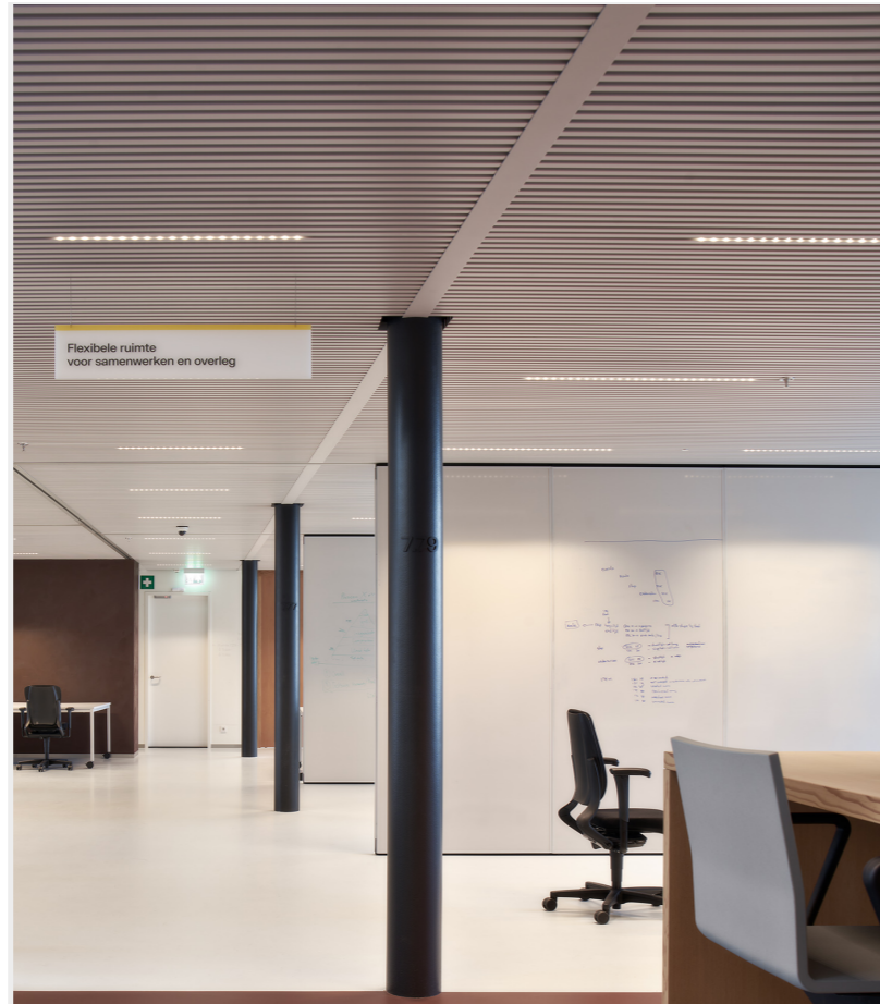
Post NL - Den Haag Multifunctionele whiteboard panelen zorgen voor creatieve werkruimtes.