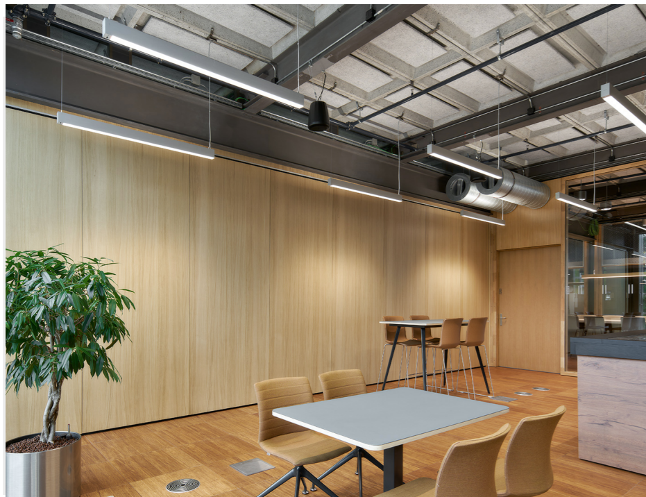
Universiteit van Twente Hout finer panelen scheiden verschillende klaslokalen