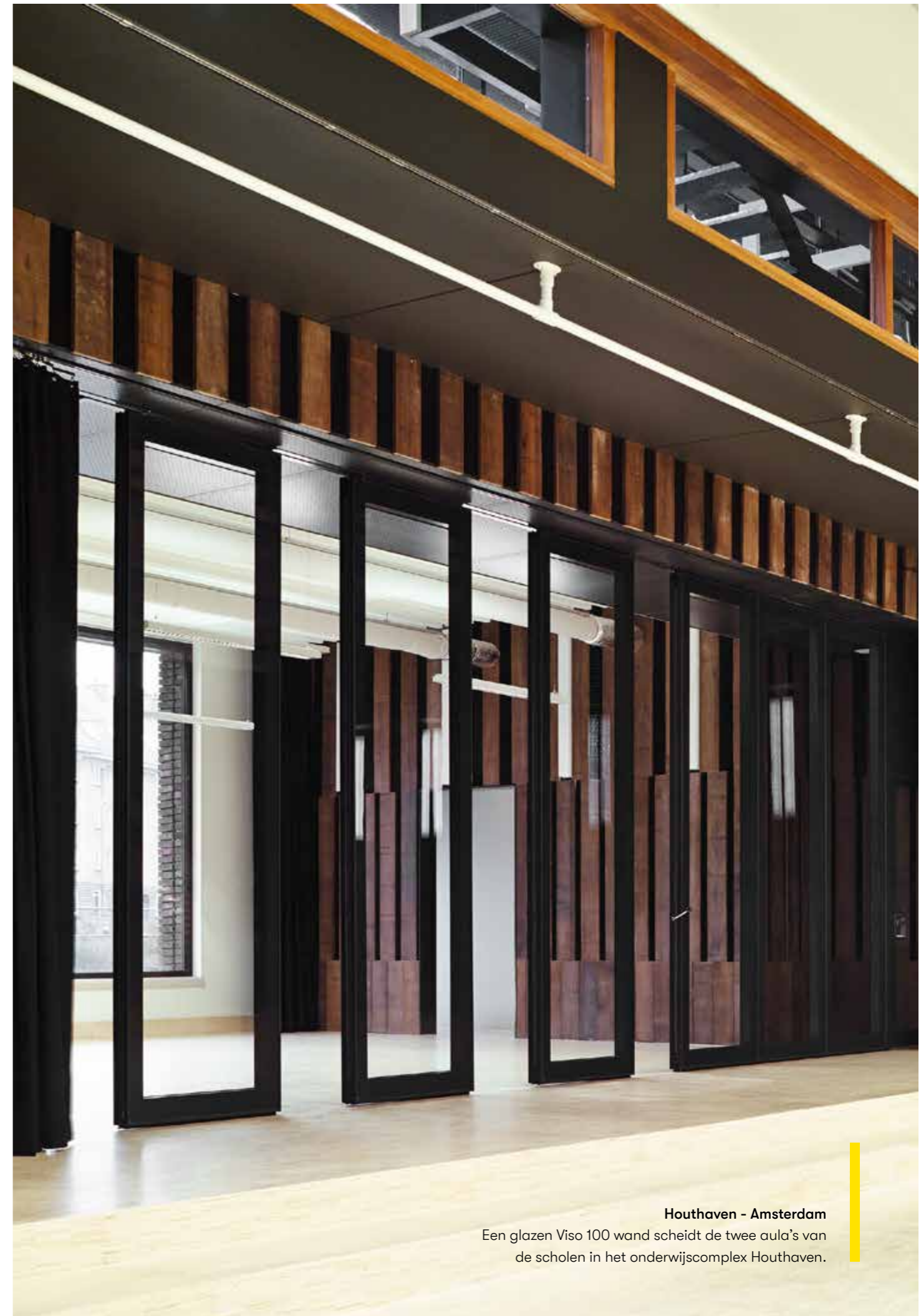
Houthaven - Amsterdam

Een glazen Viso 100 wand scheidt de twee aula's van de scholen in het onderwijscomplex Houthaven.